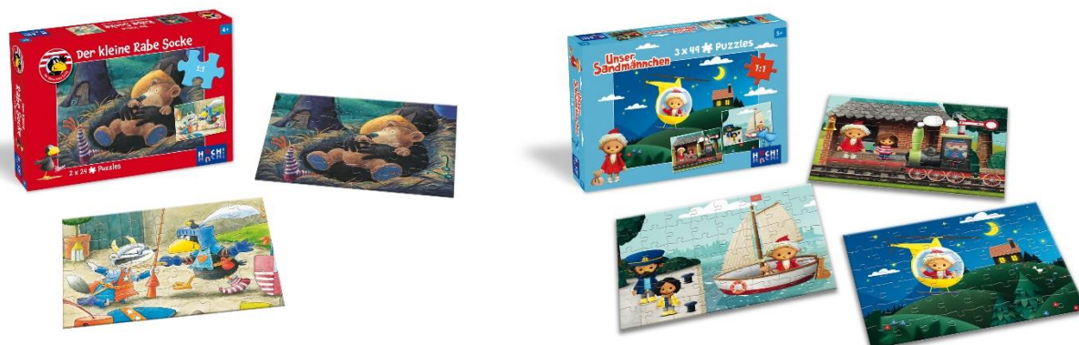
[ Der kleine Rabe Socke 2x24 Teile ca. 9,49 EUR | Unser Sandmännchen 3x49 Teile, ca. 9,49 EUR ]

Die Puzzles zu „Der kleine Rabe Socke“ oder „Unser Sandmännchen“ von HUCH! nehmen Kinder mit auf eine Reise zu ihren Lieblingshelden und richten sich an Kinder ab ca. 4 Jahren. Je nach Motiv enthalten die Boxen Puzzle-Sets aus 2x 24 Teilen oder 3x 49 Teilen.