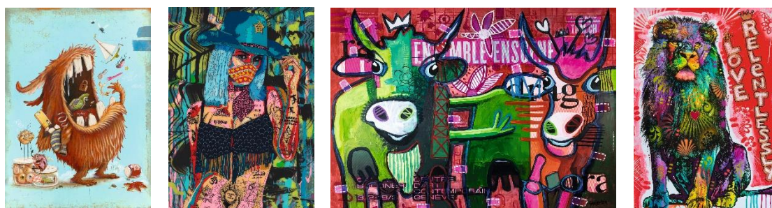
[ Zozoville, Omnivore | Timekeeper, I know you can | Cool Cattle, Striped Cows | Jolly Pets, Love Relentlessly alle Motive je 1.000 Teile, Preis ca. 15,99 EUR ]

Je höher die Anzahl der Puzzleteile, umso breiter wird auch die Motiv-Auswahl. Das Puzzleprogramm von HEYE bietet ein vielfältiges kreatives Programm von beeindruckenden Naturaufnahmen über Art Lab, Fine Art und Fantasy bis zu den lustigen und schrägen Cartoons und Wimmelbildern. Die Puzzles aus der Reihe „Pixorama“ bringen mit dem Puzzlemotiv sogar ein Rate- und Suchspiel auf den Tisch. Das Puzzleprogramm für 2022 beinhaltet zahlreiche Neuheiten von namhaften internationalen Künstlerinnen und Künstler wie Zozoville (mit skurrilen Monstern), Norman O'Flynn (mit farbenstarken Motiven), Fredi Gertsch (mit coolen Kühen), Dean Russo (mit farbenprächtigen Lieblingstieren) und vielen mehr.