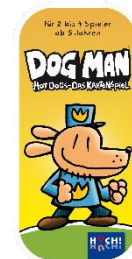
Für 2 - 4 Spieler, ab 5 Jahren Spieldauer: variabel, Preis ca. 13,99 €