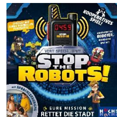
Ab 1 Spieler, ab 7 Jahren Spieldauer: 15 min., Preis ca. 30,99 €

Die Vertriebsgesellschaft Hutter Trade erblickte 2004 das Licht der (Unternehmens-)Welt. Zeitgleich wurde die Verlagsmarke HUCH! gegründet, die wiederum durch Hutter Trade vertrieben wird. Seitdem gehen die Entwicklung als auch der Vertrieb von ausgezeichneten und abwechslungsreichen Spielen Hand in Hand. Mit innovativen Kinder- und Familienspielen mit Lifestyle-Charakter, Strategiespielen und facettenreichen Vertriebsprodukten haben sich HUCH! und Hutter Trade ein ganz eigenes Profil geschaffen.