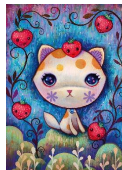
Motiv mit 1.000 Teilen Preis ca. 14,99 EUR

Hutter Trade wurde 2004 als Vertriebsgesellschaft für Brett- und Gesellschaftsspiele in Günzburg gegründet. Das Unternehmen bündelt unter seinem Dach starke und innovative Marken aus dem In- und Ausland. Diese stammen hauptsächlich aus dem Spielesektor, aber auch Lifestyle- und Geschenkartikel bereichern das Programm. Unter der Marke HUCH! entwickelt Hutter Trade zudem eigene Spielideen und betreut diese von der ersten Idee bis hin zum fertigen Produkt.