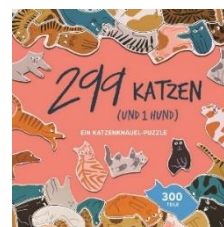
Ab 1 Spieler, ab 4 Jahren Spieldauer: 10 min..., Preis ca. 18,00 €